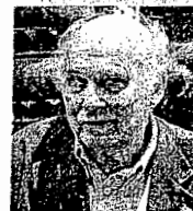
Kapuscinski.

E l fotógrafo, periodista y escritor polaco Ryszard Kapuscinski ha compaginado desde 1962 su labor periodística con la actividad literaria. Colaborador habitual de la revista Time y los diarios The New York Times , Frankfurter , El País y Allgemeine Zeitung , muestra ahora en la sala de exposiciones de la CAM en Alicante una selección de fotografías bajo el nombre de África en la mirada . El que ha sido corresponsal de guerra en 12 países de África,