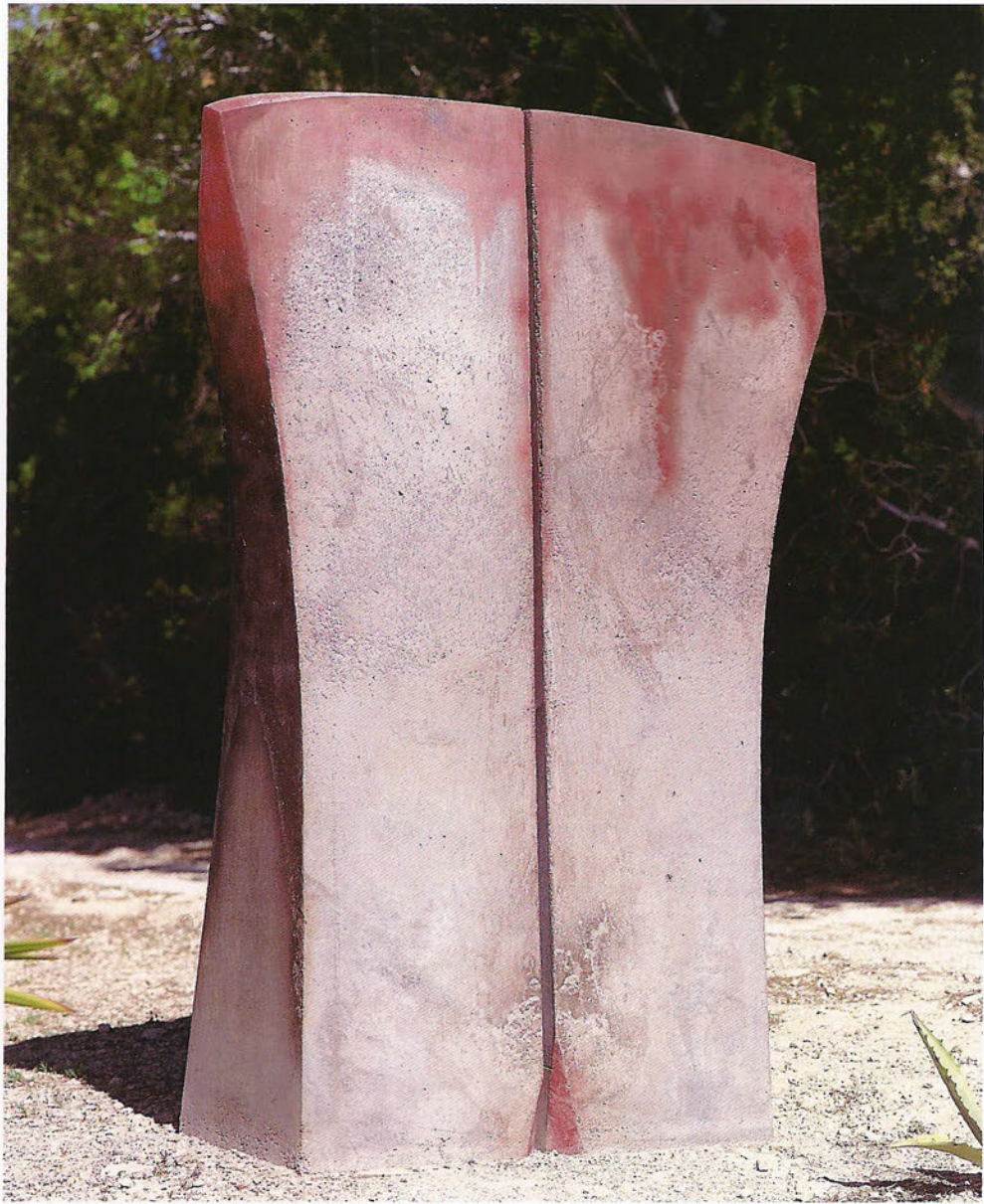
S 9711 Portal Formigó, 200 x 140 x 50 cm