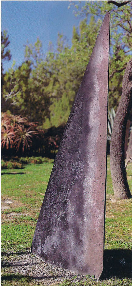
S 97/2 Geometría nocturna Formigó, 187 x 93 x 19 cm