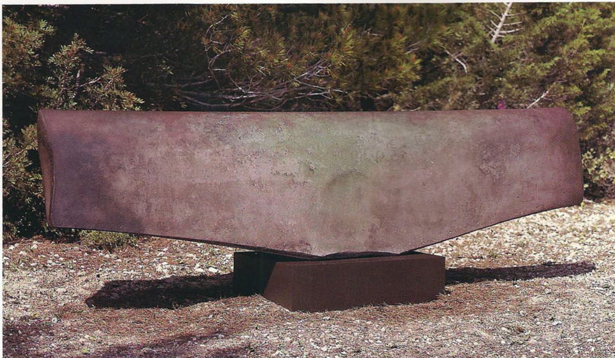
N 98 Haida Formigó, 63 x 190 x 40 cm