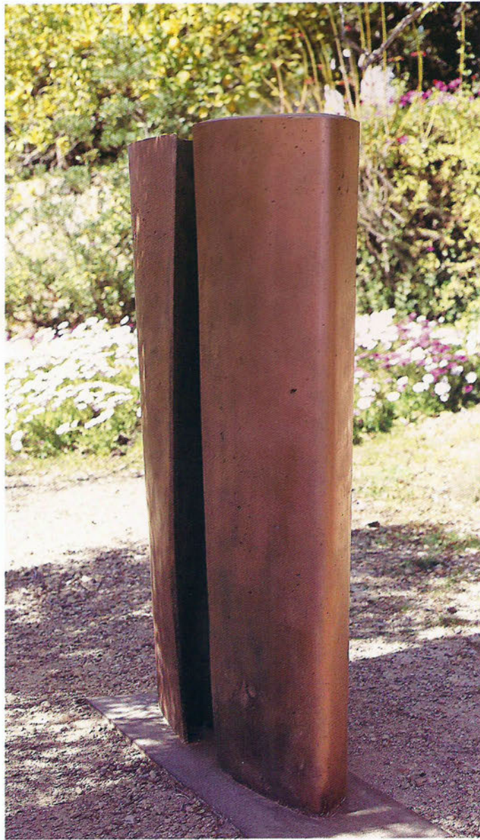
D 96/1 El sur Formigó, 150 x 92 x 33 cm