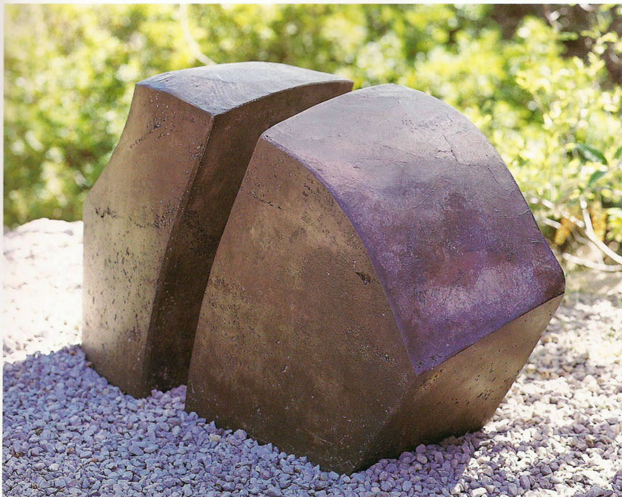
JU 9711 Amistades Formigó, 62 x 103 x 42 cm