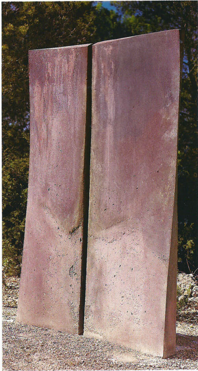
MAY 98 On the brink Formigó, 230 x 140 x 26 cm