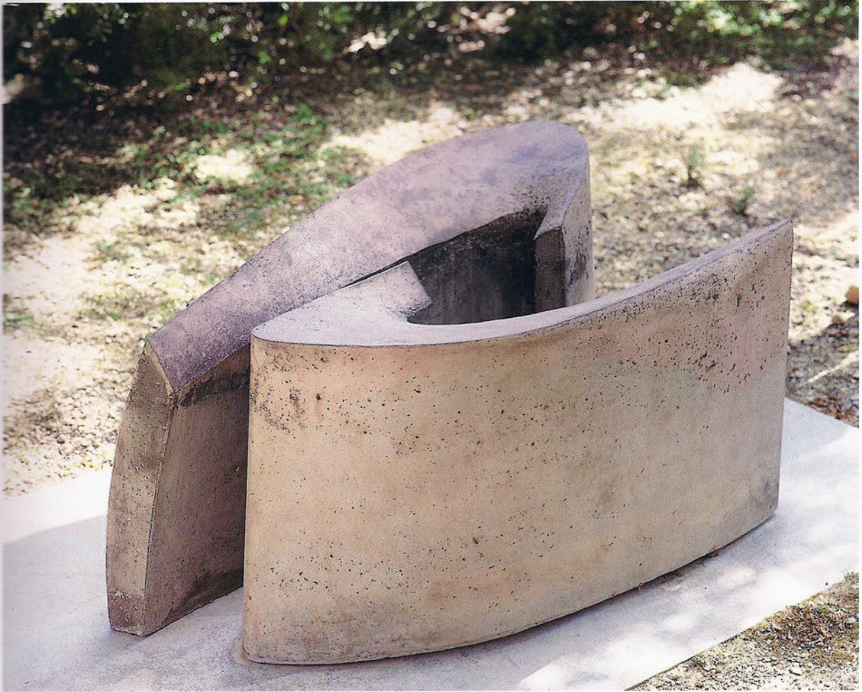
AG 95/2 Inquiring Formigó, 60 x 133 x 75 cm