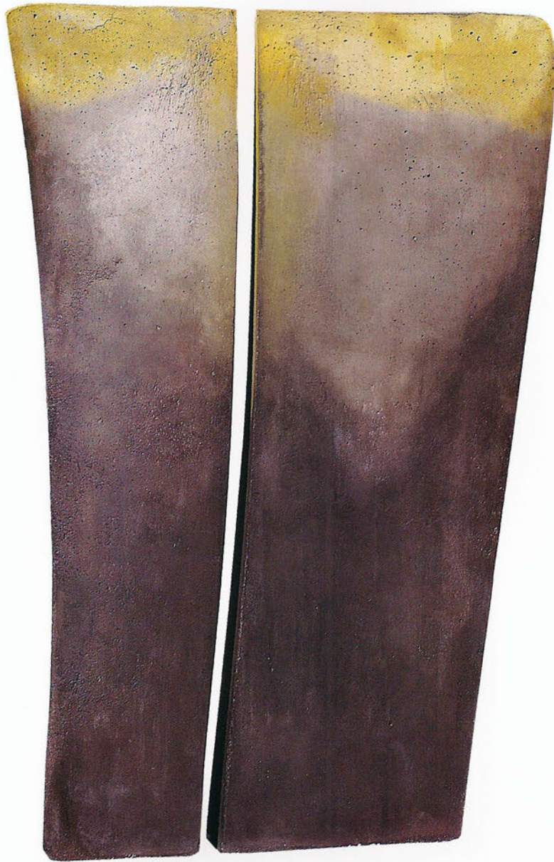
S 98/1 Sombras Pardas Formigó, 200 x 124 x 36 cm