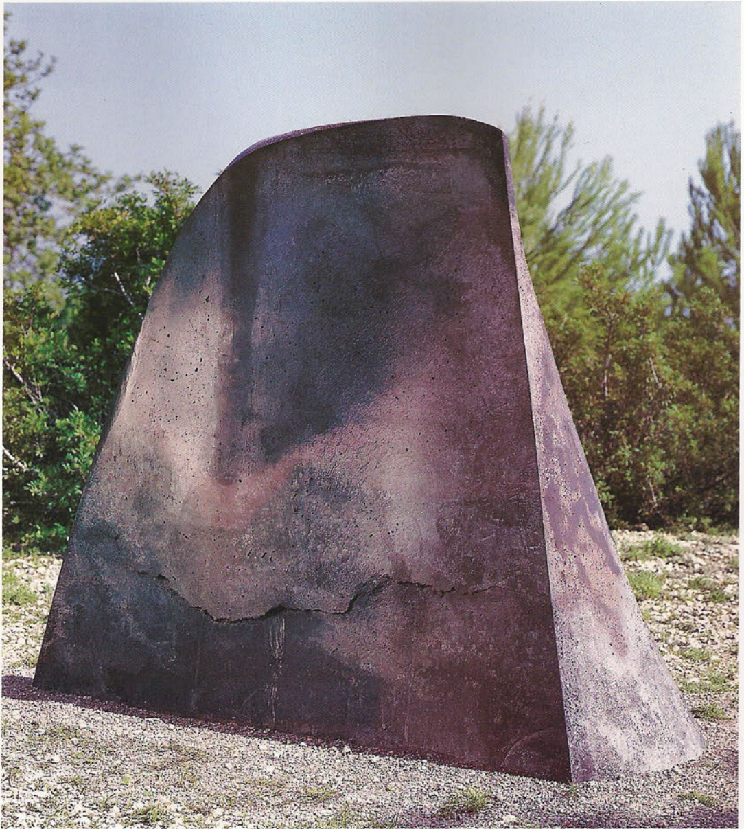
OT 97/1 Under the Volcano Formigó, 147 x 171 x 52 cm