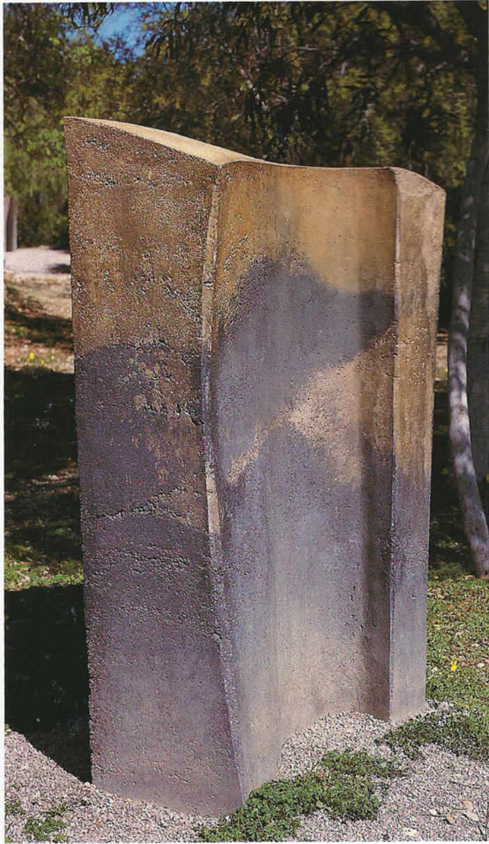
JU 96/1 Colours of a Past Formigó, 139 x 95 x 78 cm