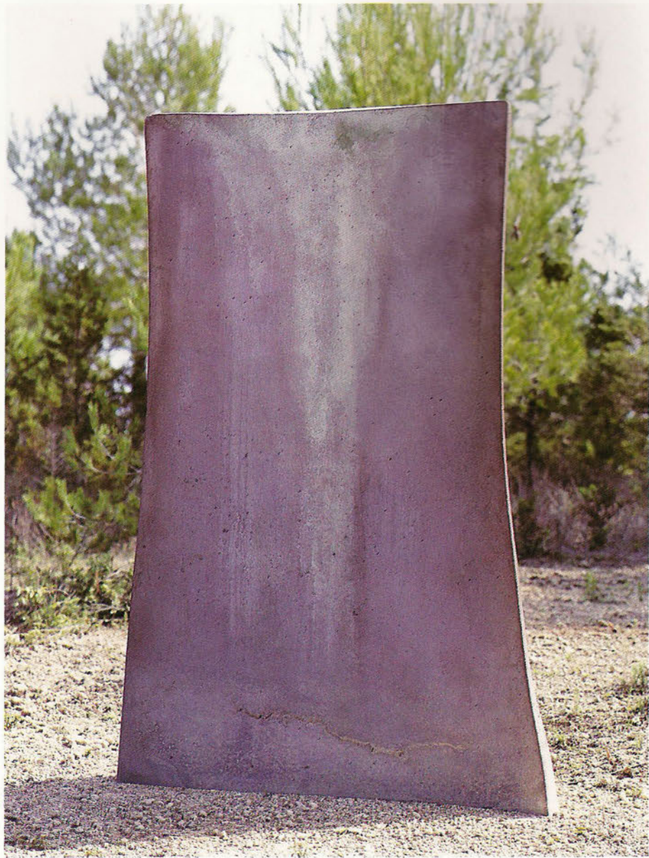
JL 98/1 Por un elefante Formigó, 200 x 123 x 13 cm