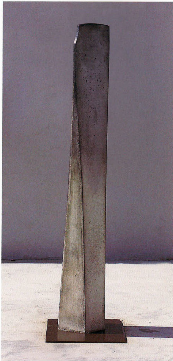
D 98/2 Estela Formigó, 198 x 30 x 25 cm