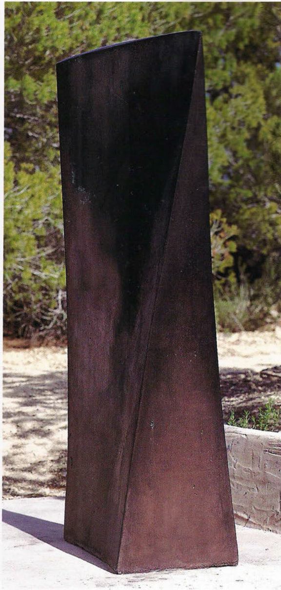
JA 98 Looking North-West Formigó, 200 x 98 x 50 cm