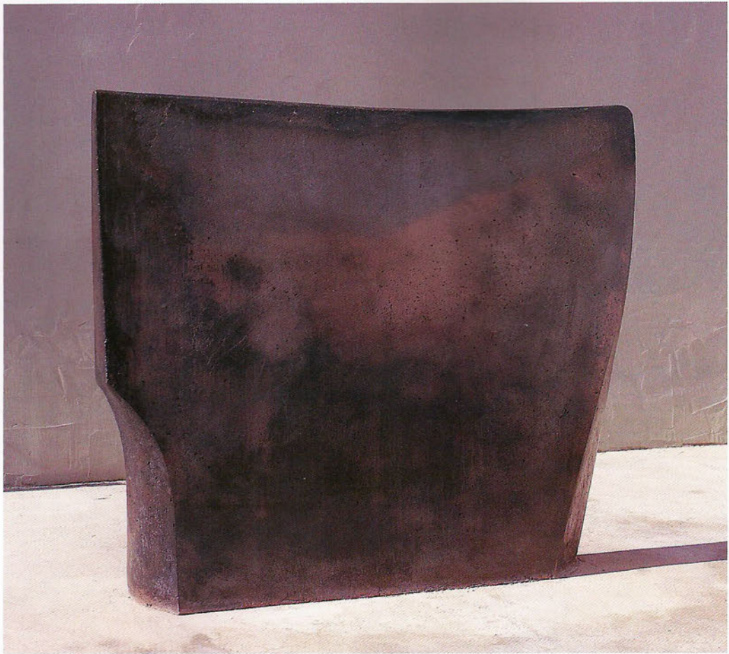
F 98/4 Sombra y rojo Formigó, 125 x 143 x 20 cm