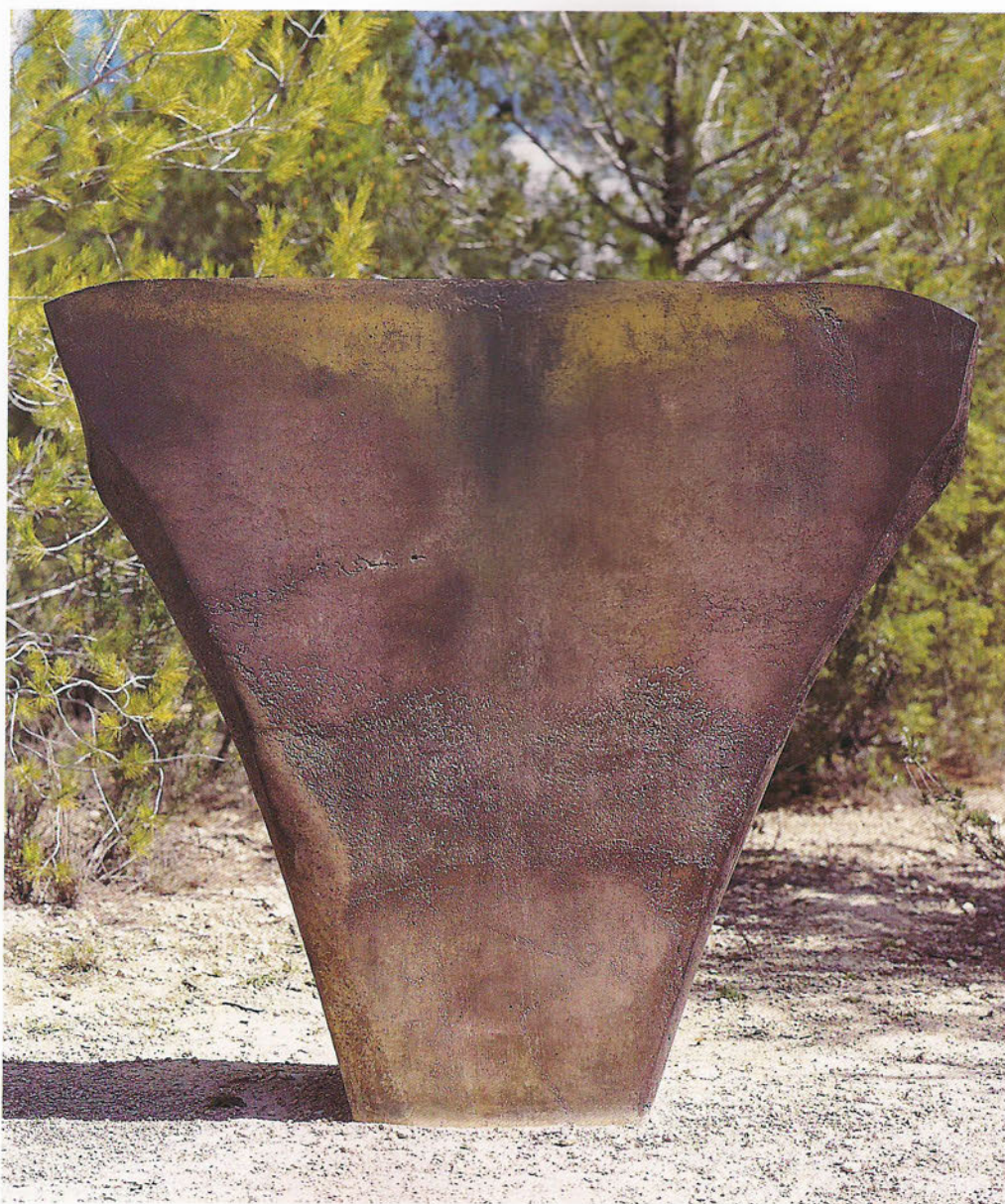
N 9711 Ciclades Formigó, 143 x 163 x 60 cm